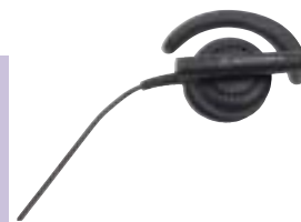
BDN6720 – Головной телефон с жесткими ободами

16-канальная радиостанция CP140 — отличный выбор для работников небольших организаций, которым необходима постоянная и экономичная связь с коллегами и руководством. Пользователи могут переключаться на дополнительный канал, чтобы обсуждать более сложные вопросы один на один.